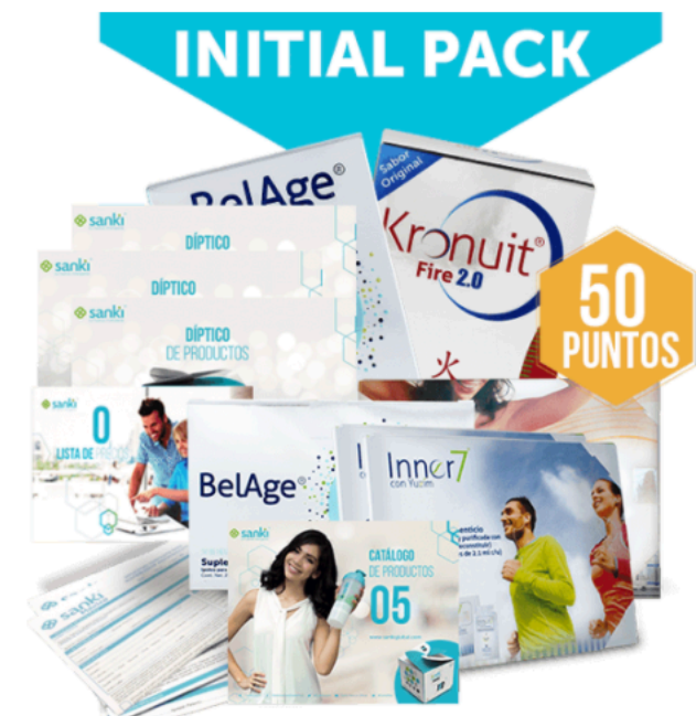
INITIAL PACK MEXICO